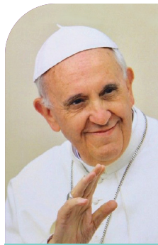
El Papa Francisco

“Todos nosotros, en la vida, necesitamos educadores; personas maduras, sabias y equilibradas que nos ayuden a crecer en la familia, en el estudio, en el trabajo y en la fe”.